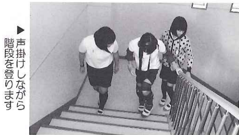
声掛けしながら階段を登ります

児童から「高齢の人が困っていたら、荷物を持ってあげるなど何か手助けをしてあげたい。」と感想があり、今回の体験で学んだことを今後に生かしてもらいたいと思いました。