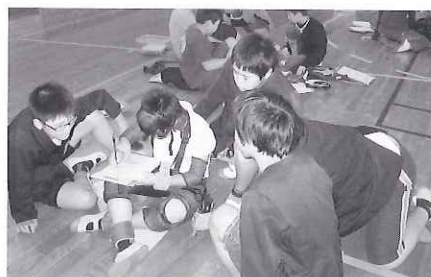
体験セットを付けて文字を書いてみました