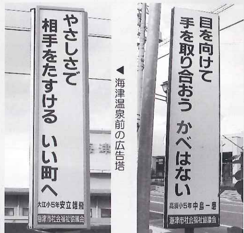
海津温泉前の広告塔