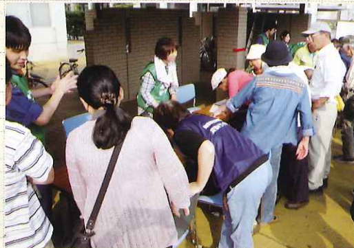
センターの受付の様子

社協として初めての訓練ということもあり、参加者から多くのご指摘を受けました。今後の活動に活かせるよう改善を重ね、大災害に備えて体制を整えていきたいと考えています。