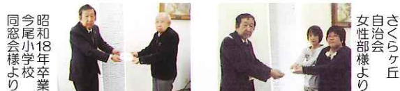
昭和18年卒業 今尾小学校 同窓会様より