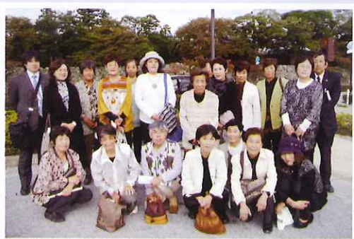
10月22日(参加者18名)『のほほ〜ん長浜』

お天気に恵まれ、気分も晴れ晴れ、和やか旅行となりました。介護者の皆さま、ご参加をいただきまして本当にありがとうございました。