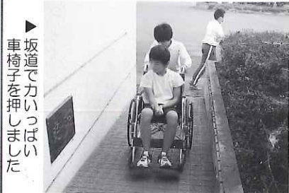
坂道で力いっぱい車椅子を押ししました

10月18日(金)東江小学校6年生が車いす体験学習を行いました。まず、車いすの種類や操作方法、介助の仕方などを学び、その後は屋外に出て車いすを体験しました。児童は、「車いすを押しってもらうときに、急に出発したり左右に曲がったりして、とてもびっくりしたので、しっかりと声かけをして車いすを押したい」と段差や坂道での大変さを感じるとともに、コミュニケーションの大切さを学びました。