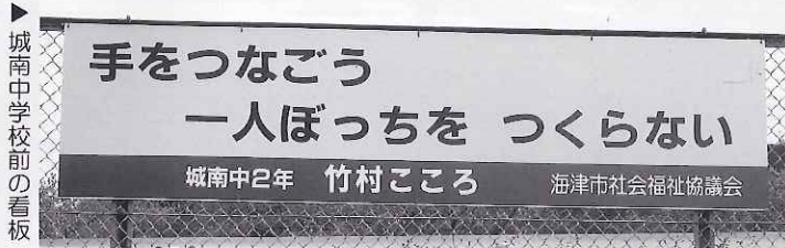
城南中学校前の看板

先月号でご紹介させていただきました平成25年度福祉標語優秀作品を看板に掲示しました。標語が掲示された看板は、ひまわり前広告塔・海津温泉前広告塔・幡長交差点広告塔・校舎敷地内にありますので、お近くに寄られた際はぜひご覧ください。