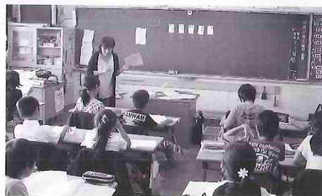
点字を学ぶ生徒たち

児童たちは初めて学ぶ点字に興味を持ち、慣れないながらも熱心に点字を打ちました。今回の体験学習で、視覚障がいや福祉に対する関心を高めることができたとともに、コミュニケーションの幅を広げることができました。