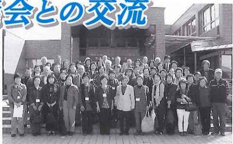
視察研修に参加したボランティアの方たち

今回の交流会で、相互のボランティア連絡協議会の活動の幅が広がったとともに、交流も深めることができました。