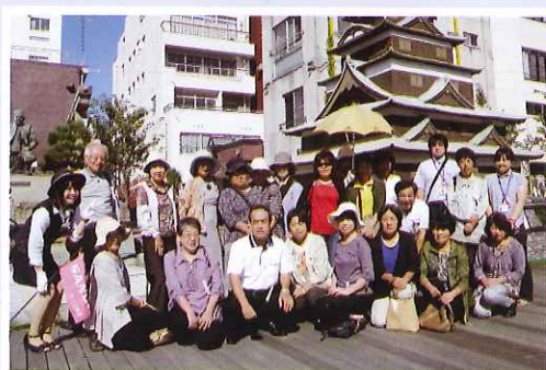
10月2日~3日(参加者22名)『のほほ〜んあわら』