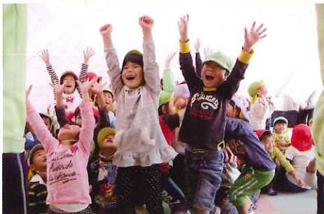
元気がいっぱいの子供たち

11月6日（水）、今尾認定こども園で、約75名の園児と交流会を行いました。海津市レクリエーション協会の方々に来ていただき、役員さんも一緒に園児らの輪に入り、園内全体が歓声と笑い声に包まれました。終始和やかな雰囲気、園児たちと楽しい時間を共有することができました。