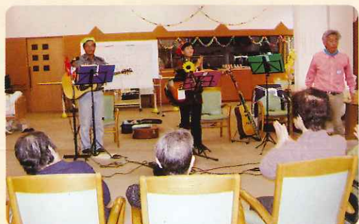
懐かしい曲に聞き入りました