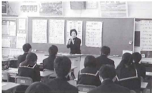
▶手話について熱心に聞きました

その後、実際に施設訪問をし、目や耳の不自由な方の日常生活などのお話を聞き、障がいについて理解を深めることができました。