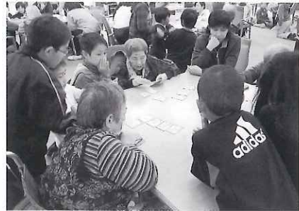
◀カルタをして楽しみました

また、優しく利用者さんに話しかけるなど、相手の気持ちに寄り添う印象が深く、良い訪問会となりました。