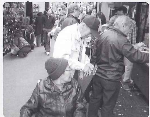
◀お千代保さんを満喫中