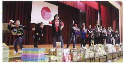
▲紙ヒコーキ飛ばして盛り上がりました

その他には、Dブロック共通の幟旗を作成し街角に立ち、年末まであいさつ運動を行いました。