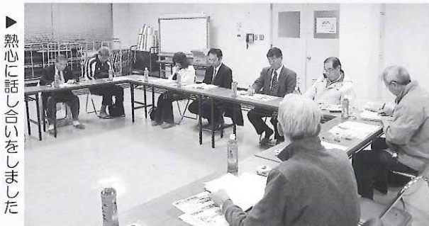
▶熱心に話し合いをしました

また9月には地域ボランティア部会内のサロン山崎との交流会を行いました。今後も部会内で交流を進めていきます。