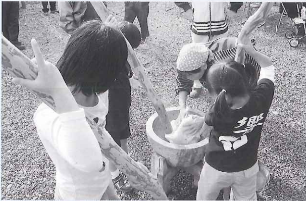
▶ 一生懸命餅つきする子どもたち

家庭では少なくなってきた本格的な餅つきが体験できて、子どもたちはとても満足そうでした。