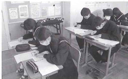
◀点字を学ぶ生徒たち