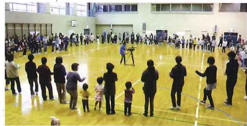
▲手をつないでマイマイムを踊りました