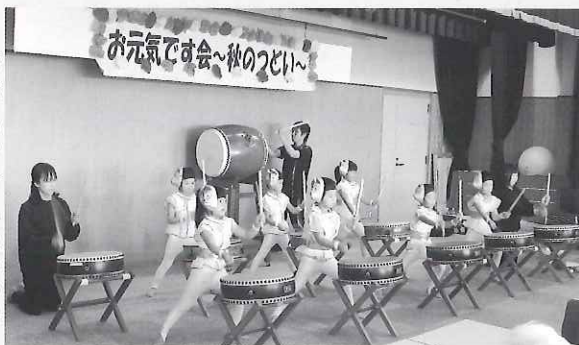
▶ 年長さんの迫力ある太鼓演奏

昼食は、ボランティアグループ「ゆう・優」さんの真心のこもった手作り弁当をいただき、楽しいひとときを過ごしました。