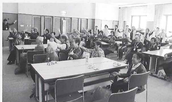
◀ 会場全員で大きく体操！