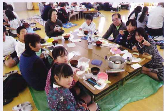
▲児童と交流を深めるサロンの皆さん

今回のお米作りやおにぎりパーティを通じてサロンさくらと石津小児童との交流がさらに深まりました。