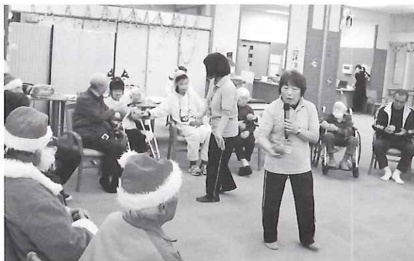
▲ボールを使った運動

12月24日（火）地域ボランティア部会は、海津市デイサービスセンター南濃で、利用者の皆さんと交流会を行いました。交流会では、まず、海津市レクリエーション協会による口の体操やボールを使った運動をし、後半は養老鉄道を守る会“かいづ”による懐かしい歌を歌いました。地域ボランティア部会は、利用者さんと一緒に手拍子をしながら、笑顔で交流会を楽しみました。今後、部会内での交流を積極的に進めていきます