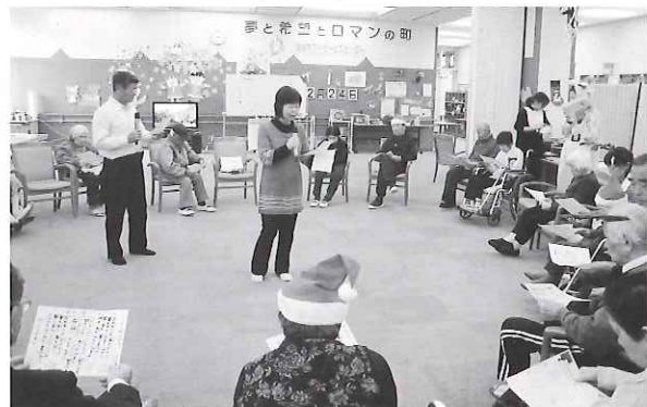
▲一緒に歌を歌いました