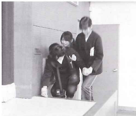
▲体験セットを付けて階段を昇りました

体験した児童から、「一緒に住んでいるおじいちゃん、おばあちゃんに優しく接し、これから色々手伝いたいです。」という心温まる感想が聞かれました。