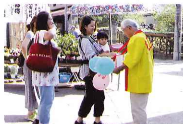
ボランティアさんのご協力をいただき街頭募金を行いました

J Aにしみの農業祭 18,605円 障がい者ふれあいコンサート 999円 海津市社会福祉大会 1,495円