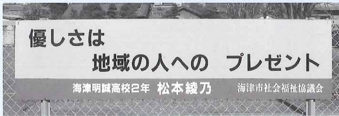
▲海津明誠高校敷地内の看板

先月号でご紹介させていただきました平成26年度福祉標語優秀作品を看板に掲示しました。標語が掲示された看板は、ひまわり前広告塔・海津温泉前広告塔・幡長交差点広告塔・校舎敷地内にありますので、お近くに寄られた際はぜひご覧ください。