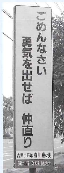
◀ひまわり前の広告塔