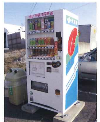
(有)サンフレッシュ海津 (帆引新田)

新たに赤い羽根自動販売機が設置されました。 この自動販売機は、売り上げの一部が共同募金に寄付され、市内の社会貢献活動に役立てられます。