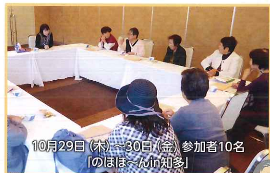
10月29日(木)～30日(金) 参加者10名 「のほほ～んin知多」