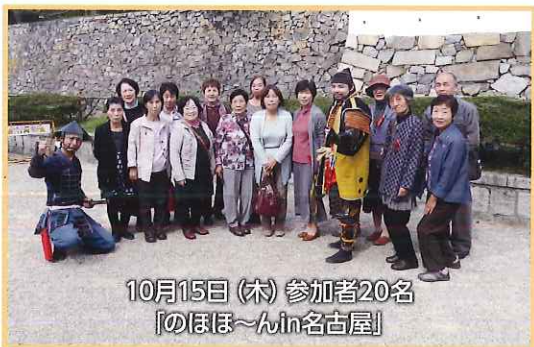
10月15日(木) 参加者20名 「のほほ～んin名古屋」

お天気に恵まれ、気分も晴れ晴れ、和やか旅行となりました。介護者の皆さま、ご参加いただきまして本当にありがとうございました。