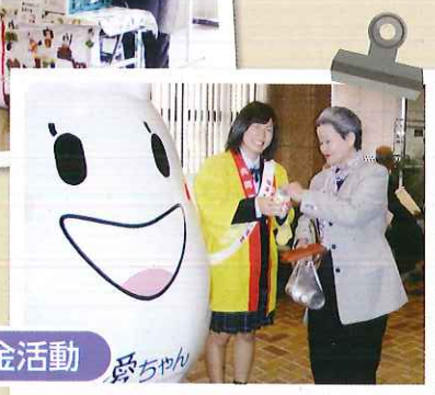
赤い羽根募金活動