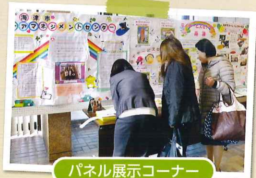
パネル展示コーナー