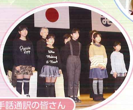
司会者と手話通訳の皆さん