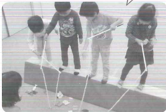
〈どれを釣ろうかな〉