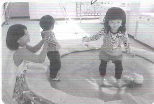
〈ぴよんぴよん高く〉