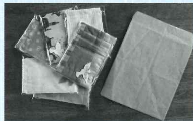
カラフルな「マスク」と「手作り紙袋」