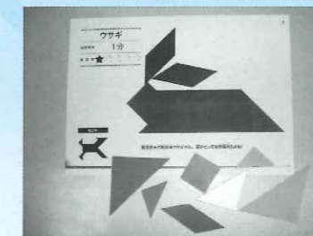
ビッグタングラム