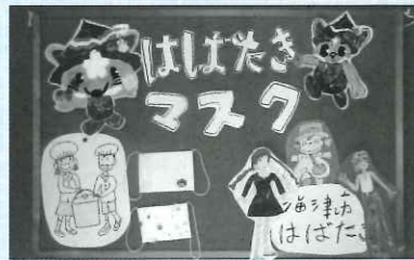
かいづっちマスク

なおマスクなどの販売は、社会福祉大会や研修会などのほか、はばたきでも販売していますので気軽にお越しください。