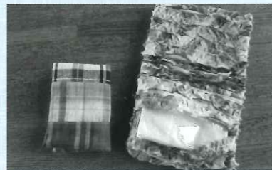
ティッシュケース