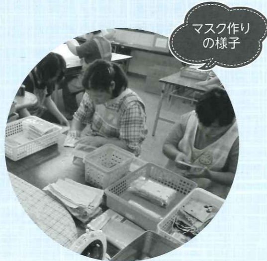
マスク作りの様子

海津市はばたき 〒503-0653 海津市海津町高須町633番地1 ☎53-3121