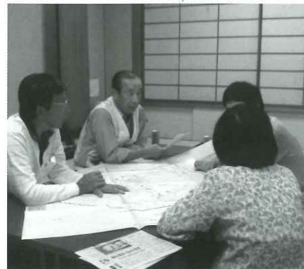
(下多度・城山地区)