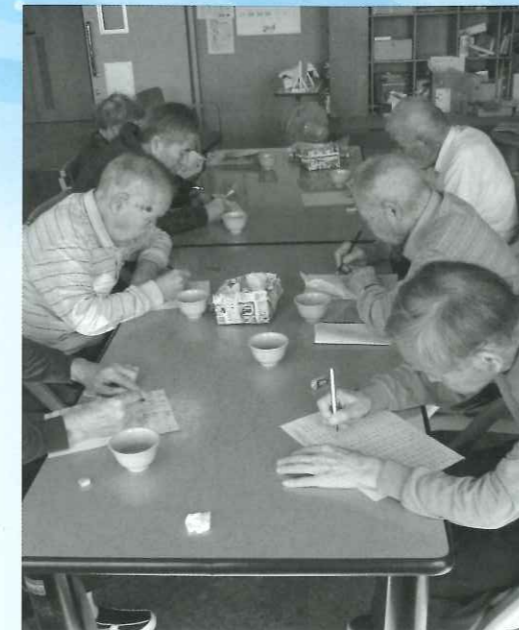
脳トレプリントに取り組まれている様子

デイサービスセンター平田では、様々な体操やレクリエーションを行っていますが、脳トレにも力を入れています。今回は、デイサービス平田で実際に利用者様が取り組まれている脳トレの一部を紹介させていただきます。