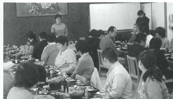
おめでとうございます