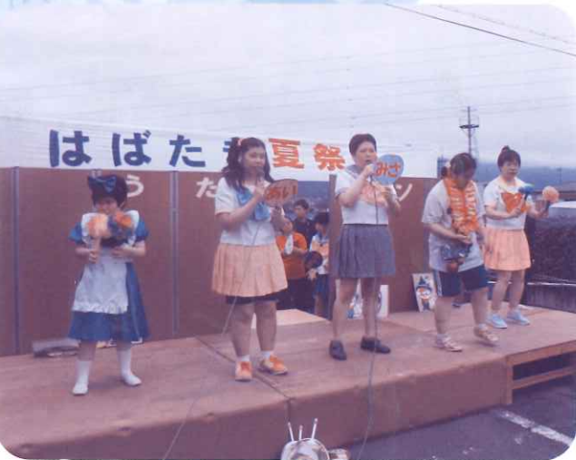
はばたき歌のコンサート

今年は「はばたき歌のコンサート」として、たくさんのお客さんの前で好きな衣装で好きな曲を披露。みんなの夢がかない、また大いに盛り上がりました。