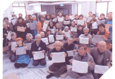
ふれあいいきいきサロン