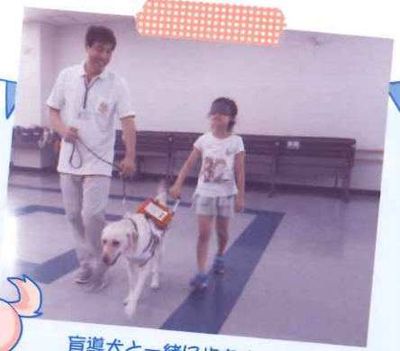
盲導犬と一緒に歩きました

7月30日(火)に開催されました「盲導犬ふれあいコース」の参加者の感想を紹介します。参加者は、アイマスク体験や点字体験、盲導犬との交流を通して、障がい者との接し方を学び、思いやりの心を育てることができました。