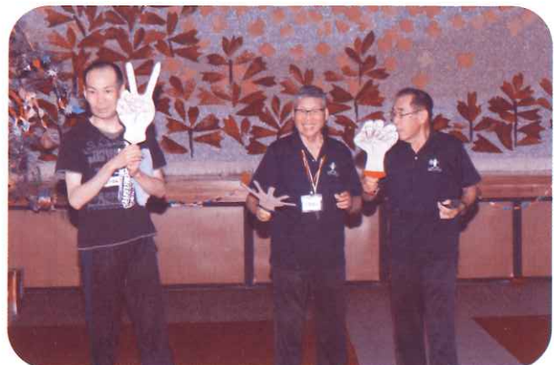
海津市レクリエーション協会のじゃんけんゲーム