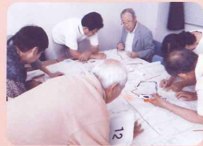
地区懇談会の様子