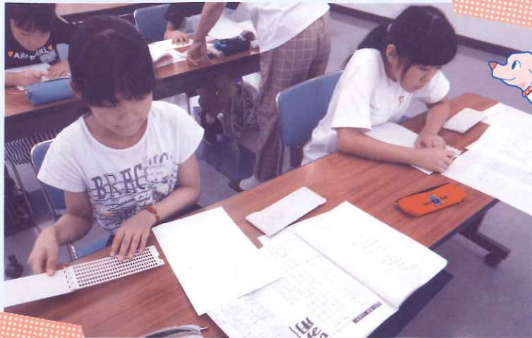
点字器を使って点字を打ちました

夏休みを利用して、市内の小学校・中学校の児童・生徒を対象としたボランティアスクールを開催しました。この事業は、体験を通して“ふくし”に興味や関心を持ってもらうことを目的としています。