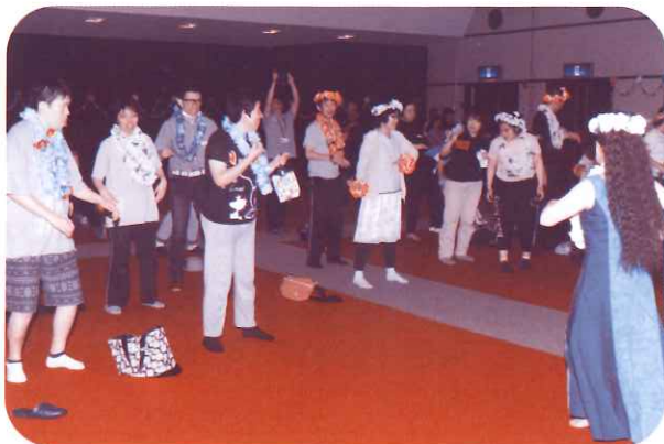
参加者と一緒にフラダンス

また、今回のたなばたま祭りに、養老ライオンズクラブからご寄付をいただき、参加者への記念品を購入させていただきました。ありがとうございました。