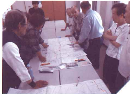
近隣助け合いネットワーク事業(福祉座談会)