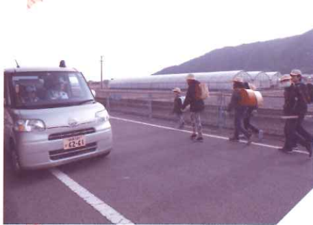
地区社会福祉協議会活動(青色防犯パトロール)