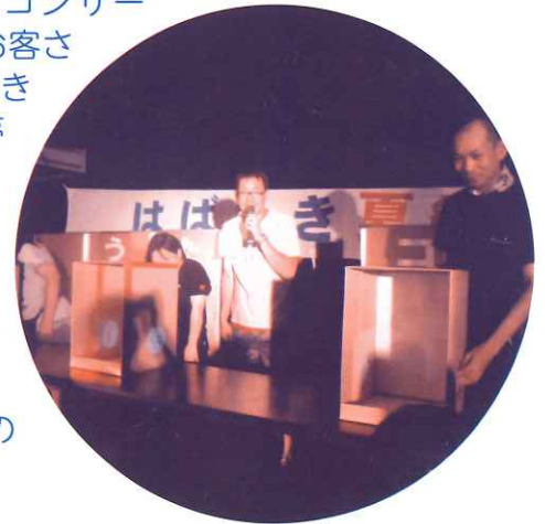
好評を博したゲーム

青年クラブ、ゆうゆうアテンダント、海津市身体障害者福祉協会青壮年部、はばたき保護者会の方々にもご協力いただき、会場は活気にあふれていました。今後も地域の皆様との交流の場を大切にしていきたいと思えます。