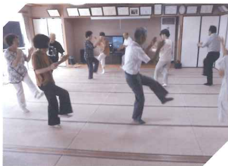
ふれあいいきいきサロン活動 (サロン平原)