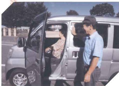
地区社協活動 (下多度地区移送サービス)