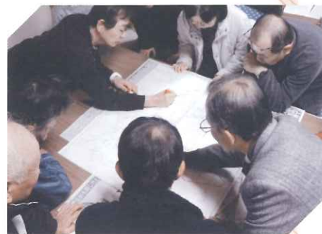
近隣助け合いネットワーク事業 (津屋二区福祉懇談会)