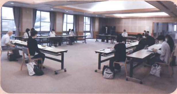
福祉協力校連絡会の様子

この事業は、市内の小学校・中学校・高等学校を対象としています。ボランティア活動や日常の身近な福祉活動を進める中で福祉への理解と関心を高め、福祉の心を育むことを目的としています。