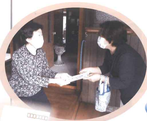
海津市社会福祉協議会