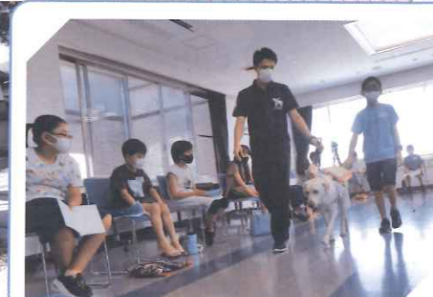
ボランティアスクール ～盲導犬ふれあい体験～