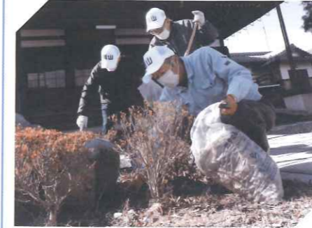
地区社協活動 ～城山生活サポート事業～