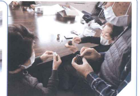
近隣助け合いネットワーク事業 ～西方(高須)自治会で丑の置物づくり～