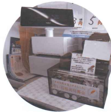
▲レジの横などに置いて頂いています。