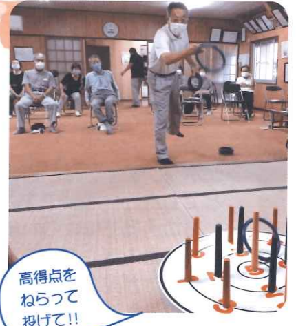
高得点をねらって投げて!!

皆さんから「コロナの前みたいに・・・」との声も聞こえましたが、コロナ禍でも楽しめる場所は大切ですね。