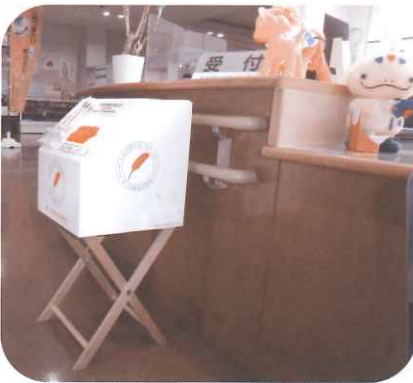
▲市内の公共施設にも設置しています。