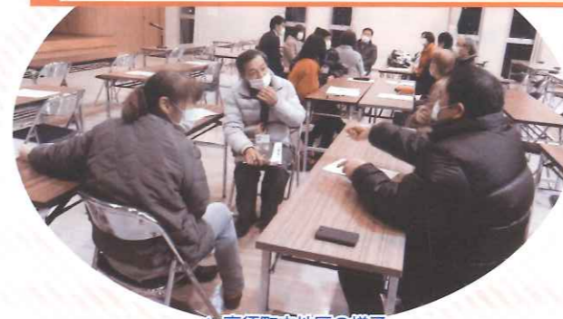
▲高須町内地区の様子