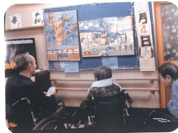
寄贈された貼り絵を見る人たち

完成した貼り絵は地元の福祉施設に寄贈しました。施設の人にも喜んでいただけ、制作に携わった人たちにも笑顔が見られました。