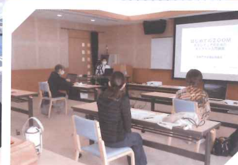
ボランティア講座 ～ボランティアのためのオンライン入門講座～