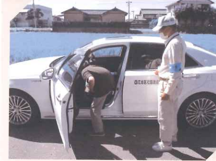
地区社協活動 ～西江地区社協 移送サービス～