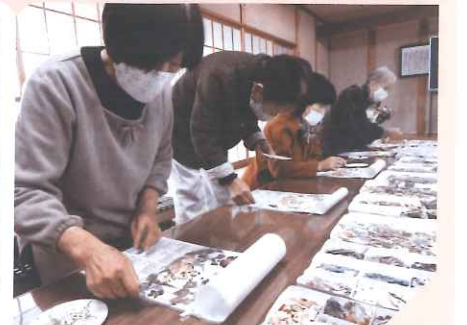
ふれあいきいきサロン ～若竹サロン 押し花でカレンダー作り～

本会は、『市民みんなで幸せな暮らしと豊かな地域社会を創る』を基本理念に、住民参加による地域福祉活動を推進する中核的な団体として活動しています。