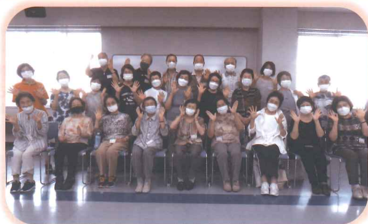
▲第1クールを受講されたみなさん