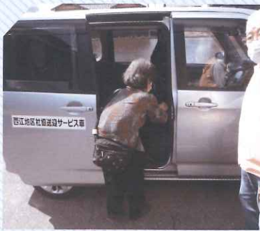
地区社協活動 ～西江地区社協 移送サービス～