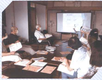
出張介護予防教室 ～サロン平原 口腔教室～