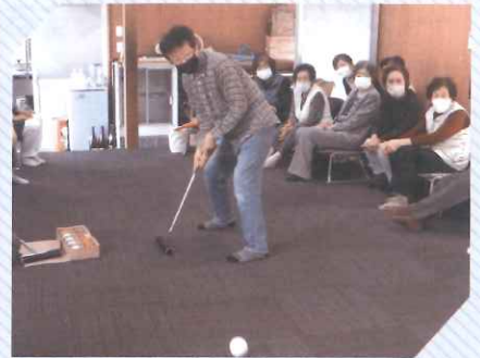
ふれあいいきいきサロン ～庭田サロン レクリエーション～

本会は、『つながりの輪で だれもが笑顔あふれるまち かいづ』を基本理念に、住民参加による地域福祉活動を推進する中核的な団体として活動しています。